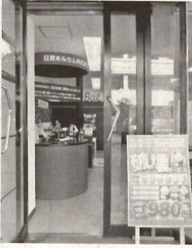
ショールームも兼ねる「拠点

レンタル事業の拠点や 製品のショールームと して機能しながら、顧 客が持ち込んだ記憶媒 体の破壊等の業務も行 える。 クラッシュボックス にはさまざまな種類が あり、磁気破壊と物理 破壊が自動で行えるプ ロフェッショナルな機 種から手動でHDDを 破壊する装置まで幅広