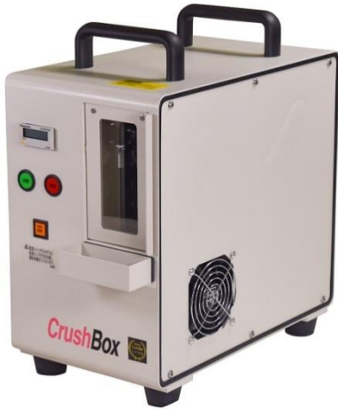
Crush Box DB-60Pro